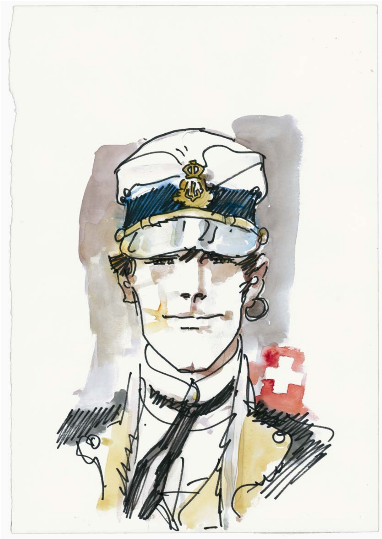
Corto Maltese © 1991, Cong SA - www.hugopratt.com - All rights reserved.