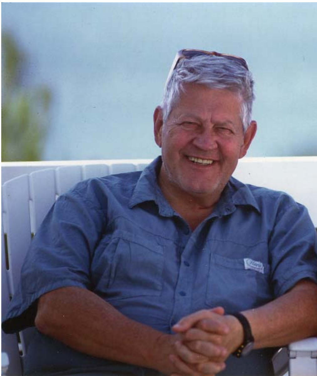
Hugo Pratt

Umberto Eco a affirmé : «Quand j'ai envie de me détendre je lis un essai d'Engels, et, en revanche, si je souhaite m'engager, je lis Corto Maltese.»