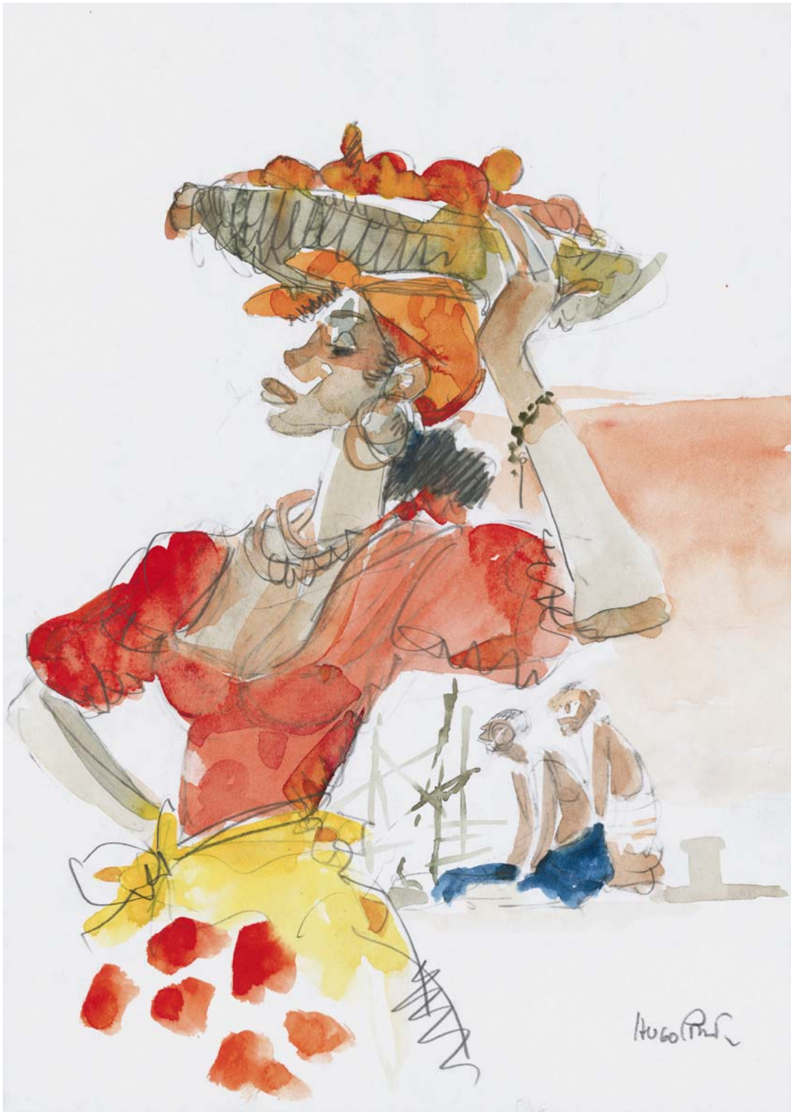
Corto Maltese – Sous le drapeau des pirates © 1991, Cong SA - www.hugopratt.com - All rights reserved