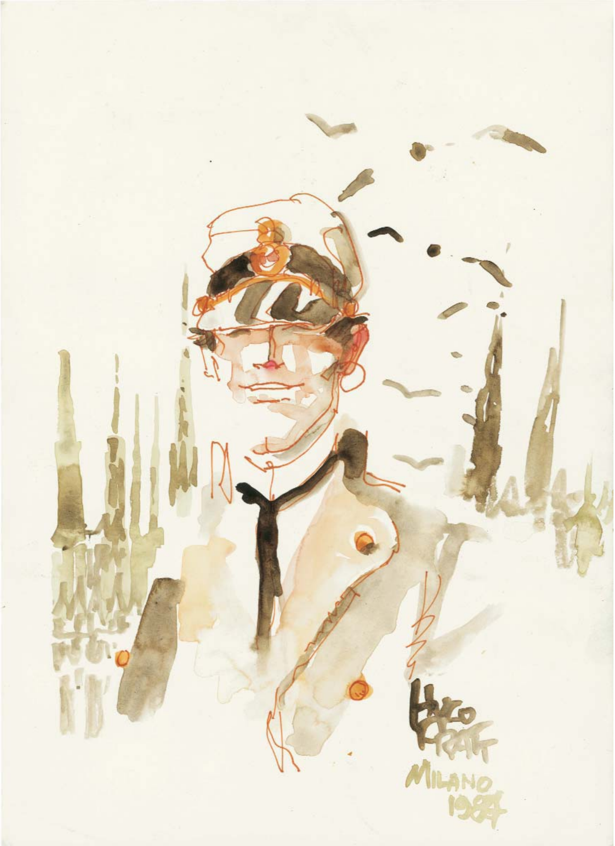
Corto Maltese © 1987, Cong SA - www.hugopratt.com - All rights reserved.